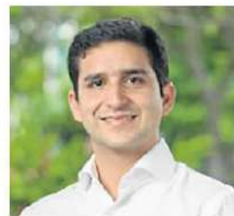
Universidad del Norte