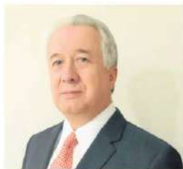
Universidad del Rosario

AÑOS CUMPLE LA FACULTAD DE CIENCIAS JURÍDICAS DE LA UNIVERSIDAD JAVERIANA.