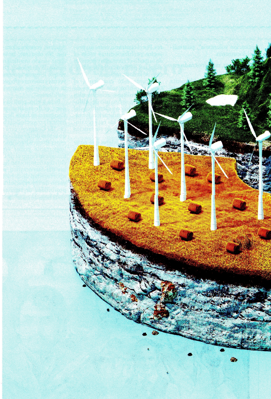
Los “Encuentros por el agua” se realizan en Colombia desde hace 10 años.

Este año, tomando en cuenta que el próximo 7 de agosto se posesionará el nuevo gobierno y que con él se pondrá en marcha un plan de gobierno que establecerá nuevos objetivos, programas, inversiones y metas desde ese momento hasta 2026, los encuentros generarán espacios de diálogo alrededor de retos y acciones prioritizadas en agua y energía, que permitan enfrentar los desafíos actuales, así como generar recomendaciones de política en ambos frentes para el nuevo Plan Nacional de Desarrollo. Entre junio y octubre habrá cinco encuentros regionales en Medellín, Manizales, Bucaramanga, La Guajira y Meta, y en noviembre se llevará a cabo el encuentro nacional, que recogerá los hallazgos de la gira regional. En todos