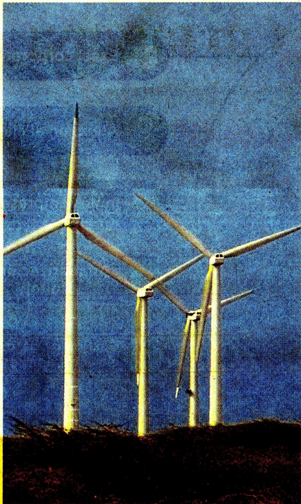
Canadá, el país invitado al Congreso de SER Colombia.