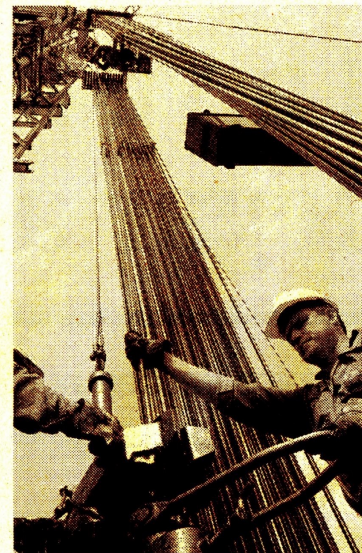
Los remanentes llegaron a los 2.039 millones de barriles.

“Al cierre del trimestre, Ecopetrol cerró con una caja de $ 16,5 billones, con inversiones comprometidas por US$986 millones ($3,9 billones)”.