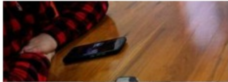
Superfinanciera y Supersociedades se unen en campaña contra

*Segundo momento: Taller de impactos y medidas de manejo. 2 de agosto de 2021, con reunión presencial. Participaron ocho funcionarios de áreas de Hidrocarburos, Ambiental y Geología de la Gobernación.