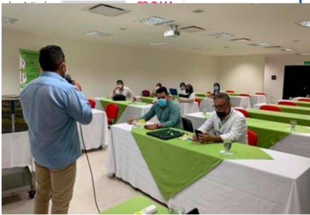
La foto corresponde al encuentro presencial para el momento dos de socialización, relacionado con el conversatorio/taller de identificación de impactos y formulación de medidas de manejo.