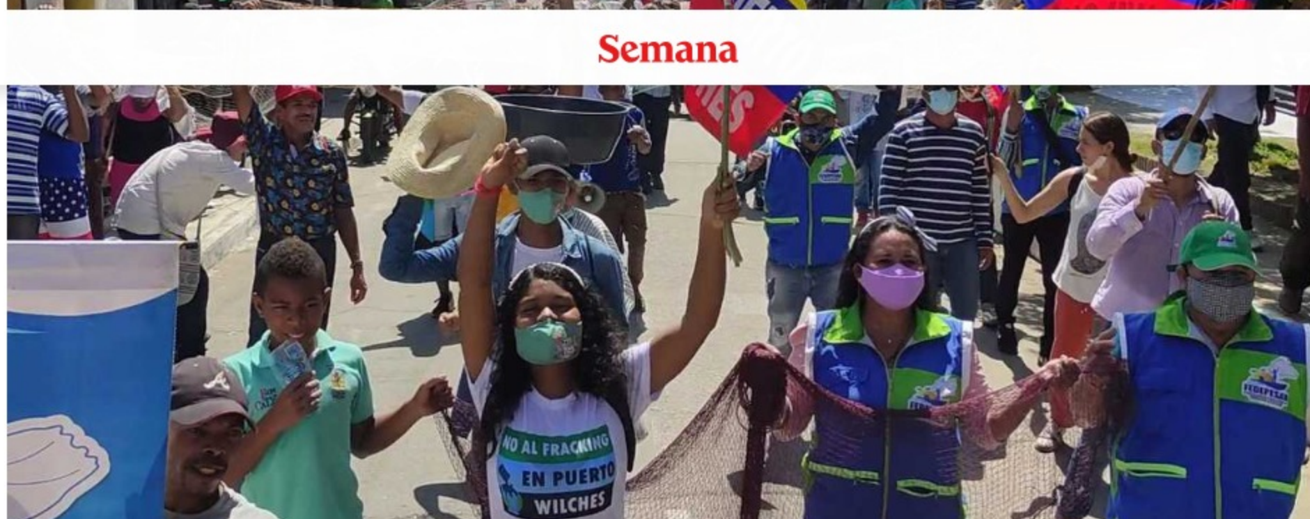
La Alianza Colombia Libre de Fracking convocó una protesta pacífica por la audiencia sobre fracking.

Como un baldado de agua fría cayó entre los habitantes de Puerto Wilches (Santander) la decisión de la Autoridad Nacional de Licencias Ambientales de autorizar el plan piloto de Fracking a Ecopetrol en este municipio, que fue anunciada el pasado lunes 28 de marzo, por lo que varios colectivos y organizaciones sociales anunciaron acciones legales para revertir esta autorización.