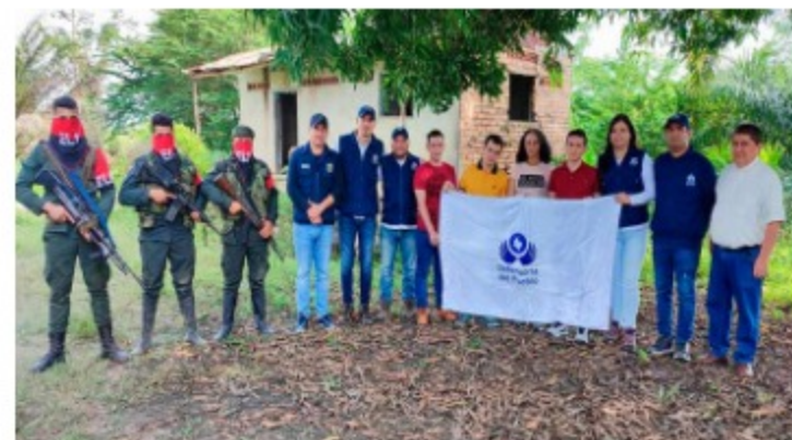
ELN libera a cinco personas en Colombia