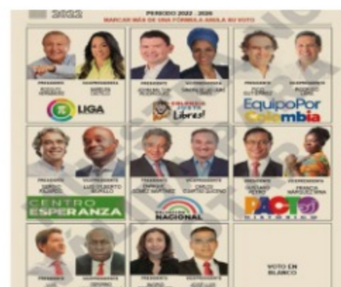
Quedó definida posición en boleta para presidenciales en Colombia