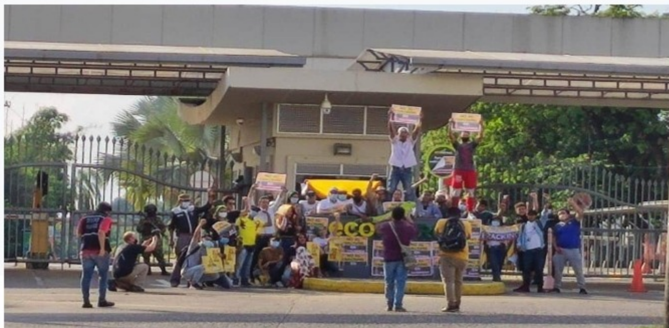
Manifestaciones en contra del fracking / Foto: Twitter (ColombiaNoFrack)

Una nueva jornada de protestas se vivió en el departamento de Santander por la aprobación de una licencia de exploración de fracking.