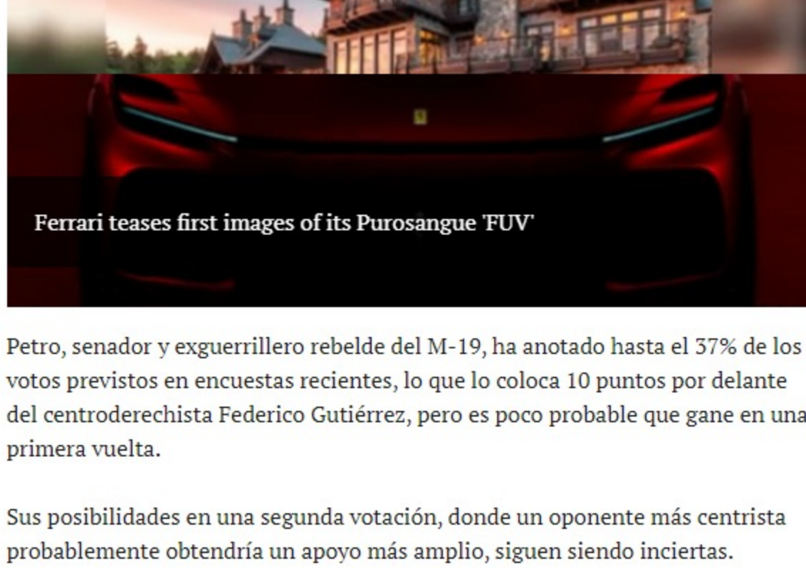
Ferrari teases first images of its Purosangue 'FUV'

BOGOTÁ (AP) — Las promesas del candidato presidencial izquierdista de Colombia, Gustavo Petro, de detener nuevos proyectos petroleros y redistribuir los fondos de pensiones podrían poner en riesgo la estabilidad económica del país, dicen los inversionistas, aunque persisten dudas sobre su capacidad para implementarlas.