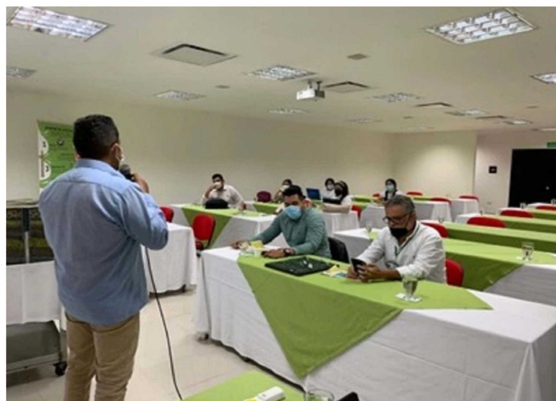
BLU Radio. Reunión Ecopetrol. Gobernación de Santander

Los proyectos pilotos Kalé y Platero están ubicado en zona rural de Puerto Wilches. ANLA vigilará el tema ambiental.