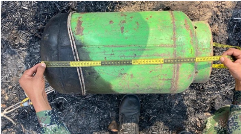
El cilindro de 55 centímetros fue instalado al costado de una vía de Ocaña.