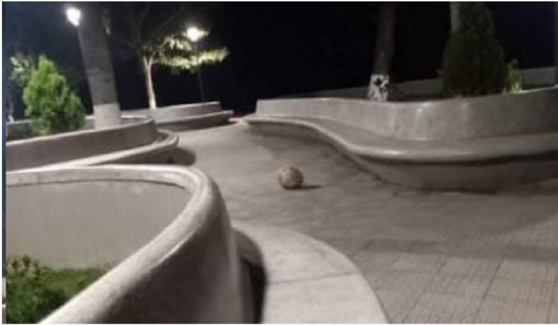
Después del hostigamiento dejaron un artefacto explosivo en el parque principal de Teorama.

Y por si fuera poco, luego del hostigamiento, los delincuentes dejaron un paquete bomba en el parque central. Al cierre de esta edición la Policía de Norte de Santander explicó que están coordinando con el Ejército para hacer el operativo y 'neutralizar' la amenaza.