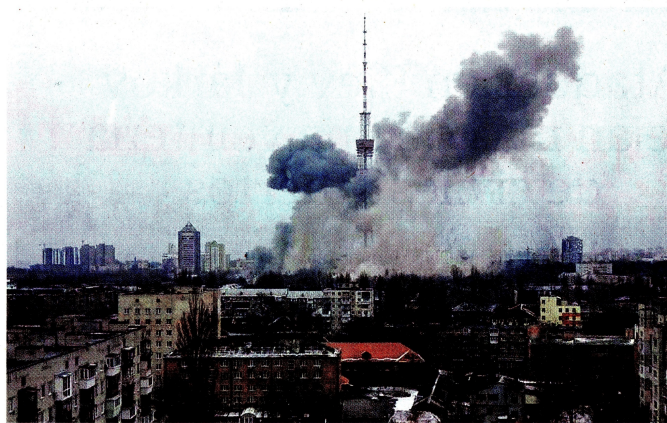
Cinco personas perdieron la vida a causa del ataque con misil que destruyó una torre de televisión en Kiev.

mocracia frente a los autócratas. “A lo largo de la historia hemos aprendido esta lección: cuando los dictadores no pagan un precio por su agresión, generan aún más caos”, dijo. Y adelantó que continuará liderando la respuesta de Occidente contra Vladimir Putin, que incluye fuertes sanciones. La economía fue el eje del resto de su mensaje. Primer plano / 1.3