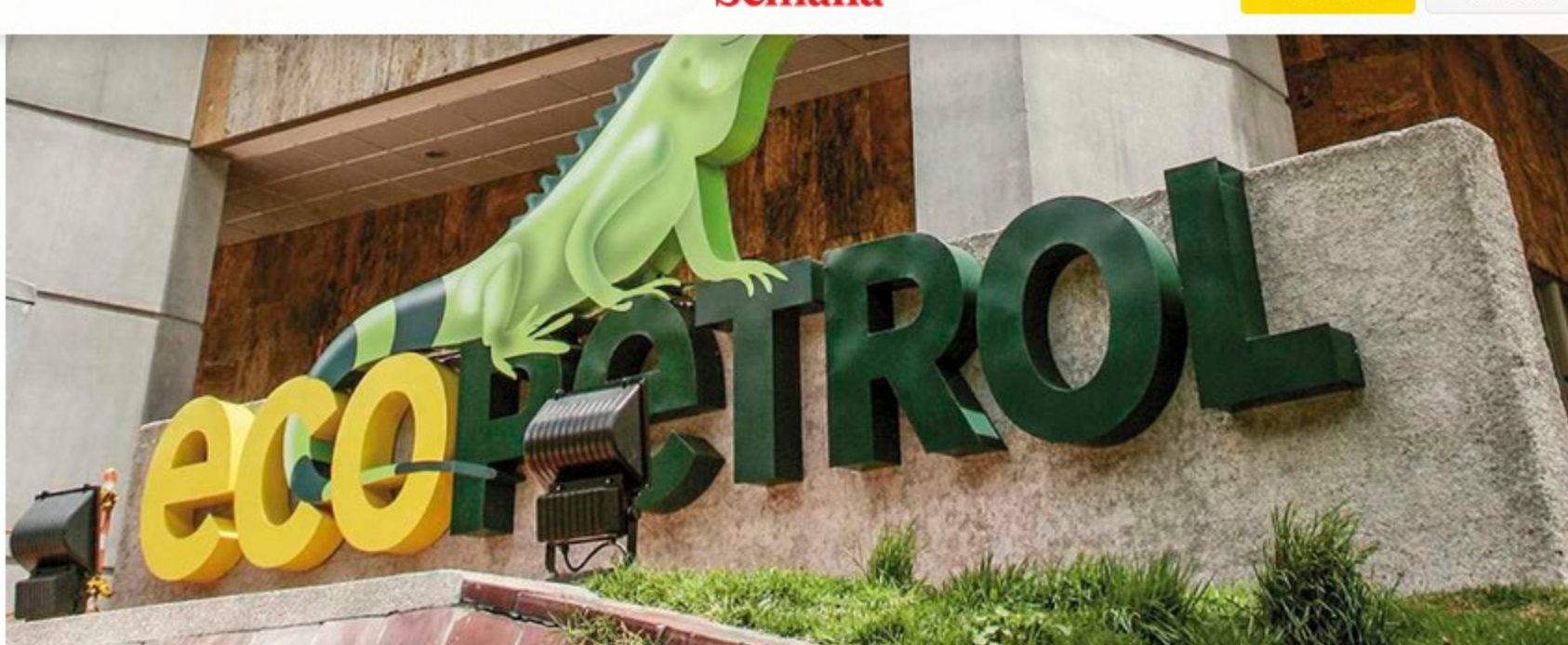
que registró en 2021 cifras récord, pagará un dividendo ordinario de $243 por acción y uno extraordinario de $37 por acción.

Tras registrar en 2021 las mejores ganancias en toda su historia, la Junta Directiva de Ecopetrol aprobó presentar el proyecto de distribución de utilidades para sus accionistas el próximo 30 de marzo de 2022 en la Asamblea General de Accionistas, que luego de dos años será presencial.