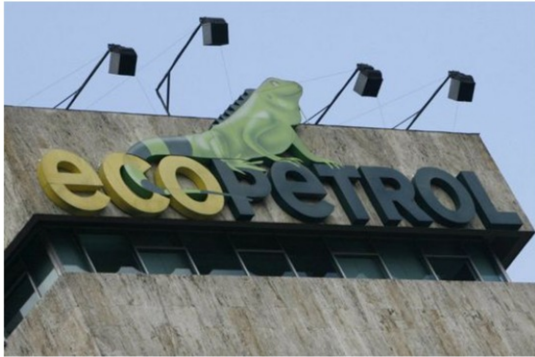
Importante hallazgo petrolero anunció Ecopetrol en el Piedemonte Llanero.