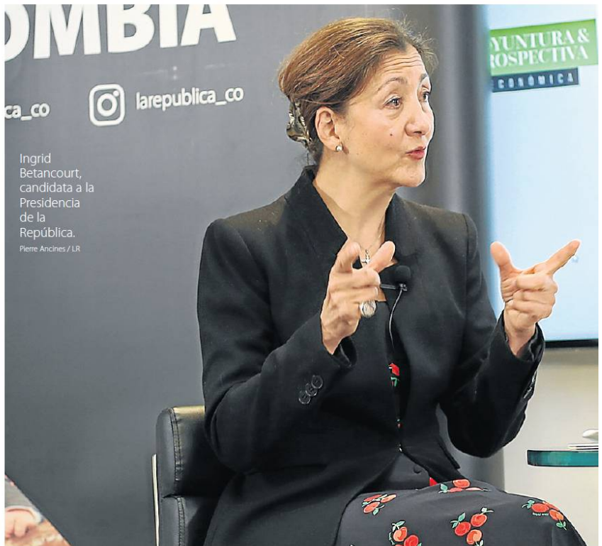
Ingrid Betancourt, candidata a la Presidencia de la República.

Pero diferir el tema a 10 años nos crea problema inmediatos, pues afecta la cotización de Ecopetrol en las bolsas internacionales y esto afecta lo que las trans-