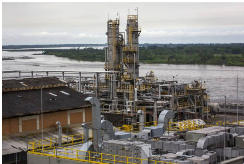
Refinería de Ecopetrol SA La refinería de Ecopetrol SA se encuentra en Barrancabermeja, Santander, Colombia, el viernes 20 de abril de 2018.

La petrolera de mayoría estatal tuvo utilidades superiores a las de 2020 cuando la pandemia afectó su balance. Produjo 679 mil barriles diarios en promedio