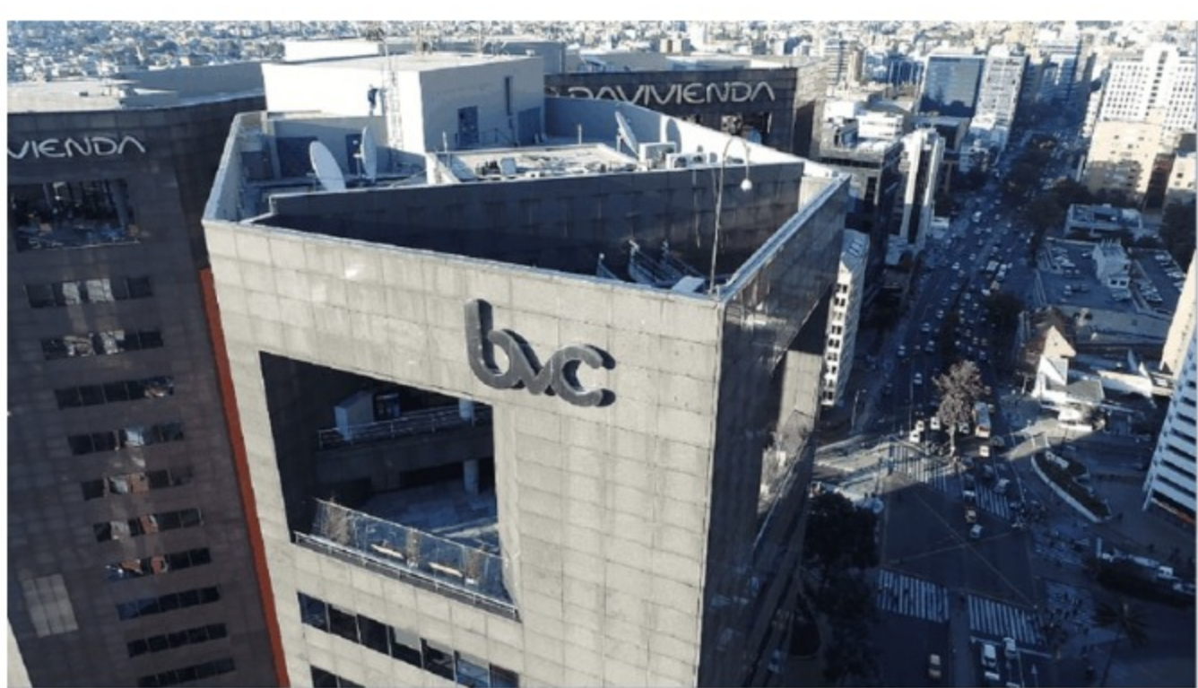
Bolsa de Valores de Colombia (BVC)

La petrolera sube casi un 2% y junto a Bancolombia impulsan la cotización del índice MSCI Colcap que aumenta tras la tercera temporada de OPA por el GEA