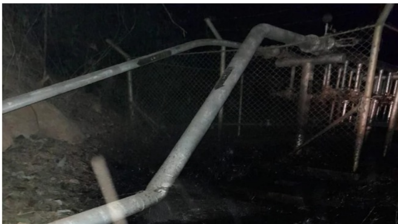
Atentado en campo petrolero Cira-Las Infantas fue denunciado por Ecopetrol

En contexto | Reportan atentado a dos tuberías de Ecopetrol en Barrancabermeja