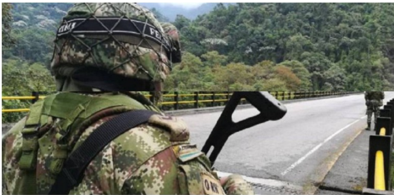
El Catatumbo / Colprensa

Advierten que hacen esfuerzos por no reducir la operatividad y piden mayor acompañamiento