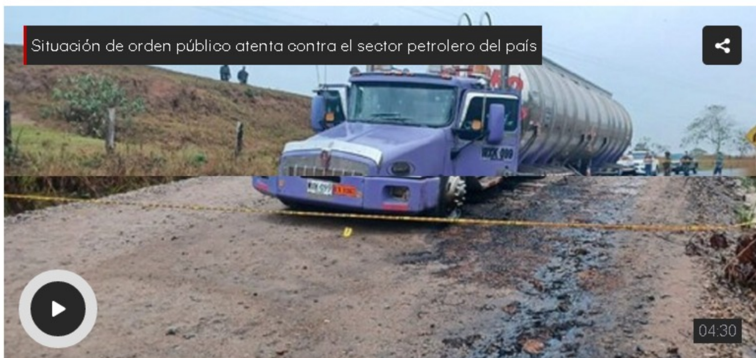
Situación de orden público atenta contra el sector petrolero del país

La situación es delicada por la decisión del ELN de atentar contra el país con el propósito político.