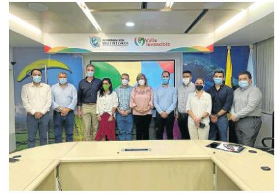
Gobernación del Valle

Hacen llamado a Iván Duque por vía del Valle