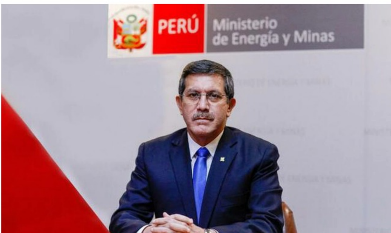
El funcionario aclaró que no existe, de momento, riesgo de desabastecimiento de derivados de petróleo .

Perú tendría la opción de recurrir a mercados vecinos, liderados por empresas de capitales públicos, en caso Repsol no subsanara a tiempo las observaciones de OEFA, ya que no podría autoabastecerse a nivel local.