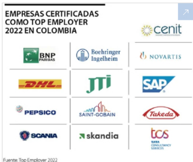
Fuente: Top Employer 2022