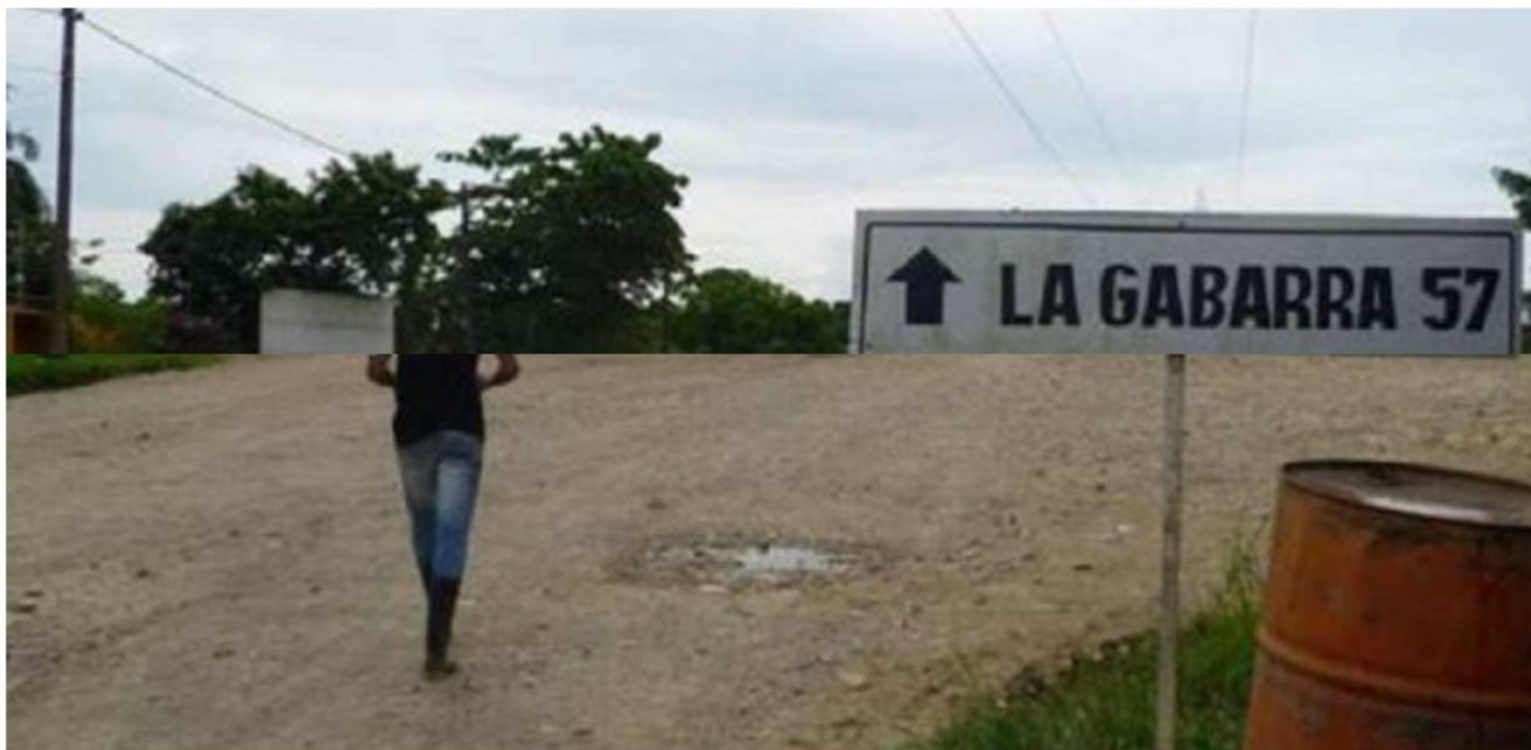
Tibú, Norte de Santander

En los dos primeros días, a más de 100 trabajadores le han cancelado su contrato laboral