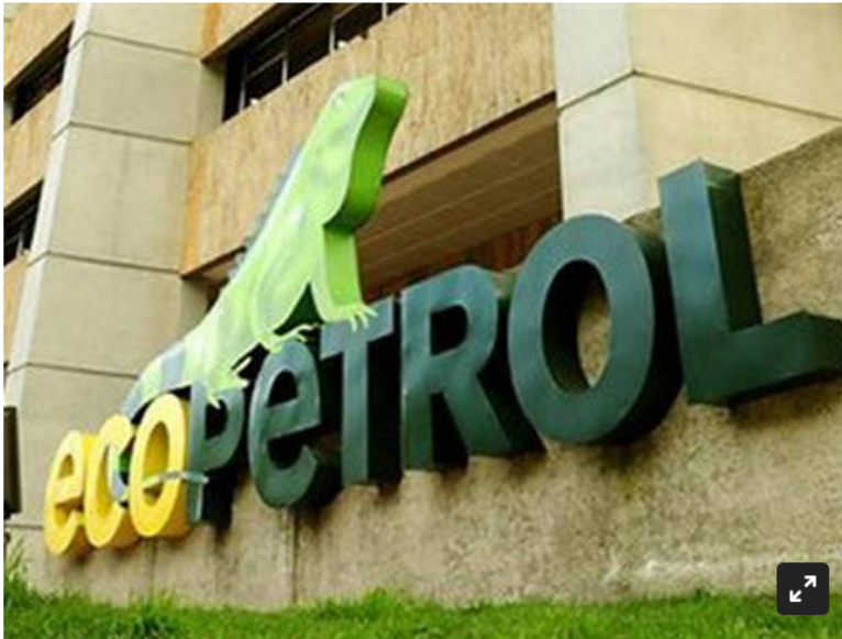
La comunidad pide mayor claridad sobre el proyecto.

Ante la Anla se hizo la solicitud, sin embargo, las comunidades aseguran que podría presentarse impacto ambiental en zonas hídricas.