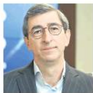
JUAN PABLO CORDOBA PRESIDENTE DE LA BVC

Córdoba es el personaje del día después de que el índice bursátil de la Bolsa de Valores de Colombia (BVC) , Msci Colcap, avanza con fuerza y retomara los niveles pre-pandemia. La cotización superó los 1.500 puntos y logró llegar a niveles de hace cinco años.