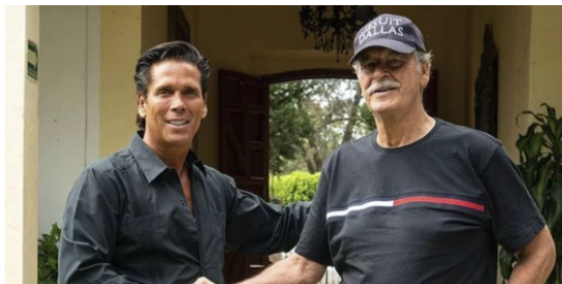
El actor Roberto Palazuelos mostró en sus redes sociales su reunión de negocios con el expresidente.