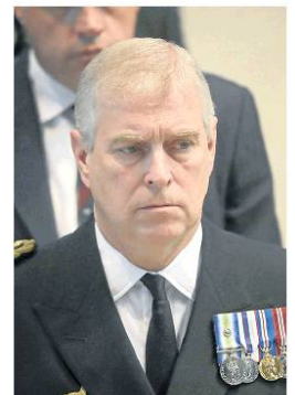
El príncipe Andrés enfrenta acusaciones de abuso sexual en la red de trata de Jeffrey Epstein.

El príncipe Andrés dejó de representar públicamente a la familia real de Inglaterra después de una desastrosa entrevista con la BBC en 2019 en la que intentó sin éxito disipar las sospechas relacionadas con su amistad con el difunto Jeffrey Epstein y su pareja, Ghislaine Maxwell.