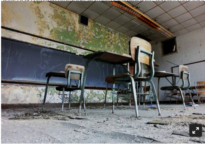
Ali Jarvis / EyeEm

Sigue La W continúa con el especial ¿Usted estudiaría aquí?, revelando el estado de colegios públicos en el país. En el