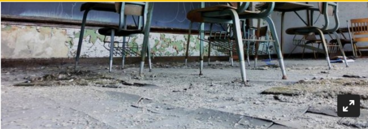
Ali Jarvis / EyeEm