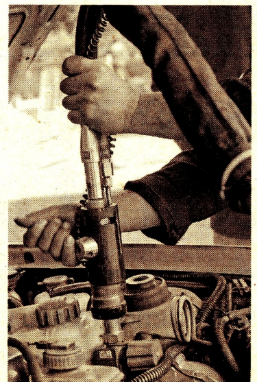
Cerca de 1.700 vehículos en el país operan con el GNV. Federico Puyo

Cabe recordar que a la fecha, el país cuenta 1.365 MW de energía solar y eólica que lograron asignaciones en la subasta de 2019, pero que al finalizar el 2023, la cantidad de megavatios de capacidad instalada en la matriz de generación será del 15%, si se tiene en cuenta que para el 2018 no era del 1%.@