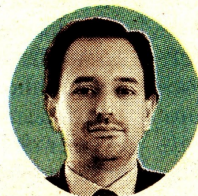
DIEGO MESA Ministro de Minas y Energía

“Es un hito muy importante saber que contamos con nuevos agentes que ingresan al mercado y entender que las reglas y el negocio de energía son atractivos para los inversionistas. Colombia