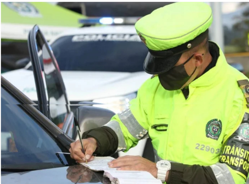
Su modelo de operación debe reportarles a los miembros de esta pequeña fracción corrupta jugosos extrasueldos a cada individuo

La corrupción en grande es rampante y genera ira y desconsuelo en la ciudadanía. Odebrecht y Reficar son palabras mayores. De la que poco se habla es de la pequeña corrupción, al detal, que ocurre a diario frente a nuestras narices. Una de las de ocurrencia cotidiana corre a cargo de miembros de la Policía.