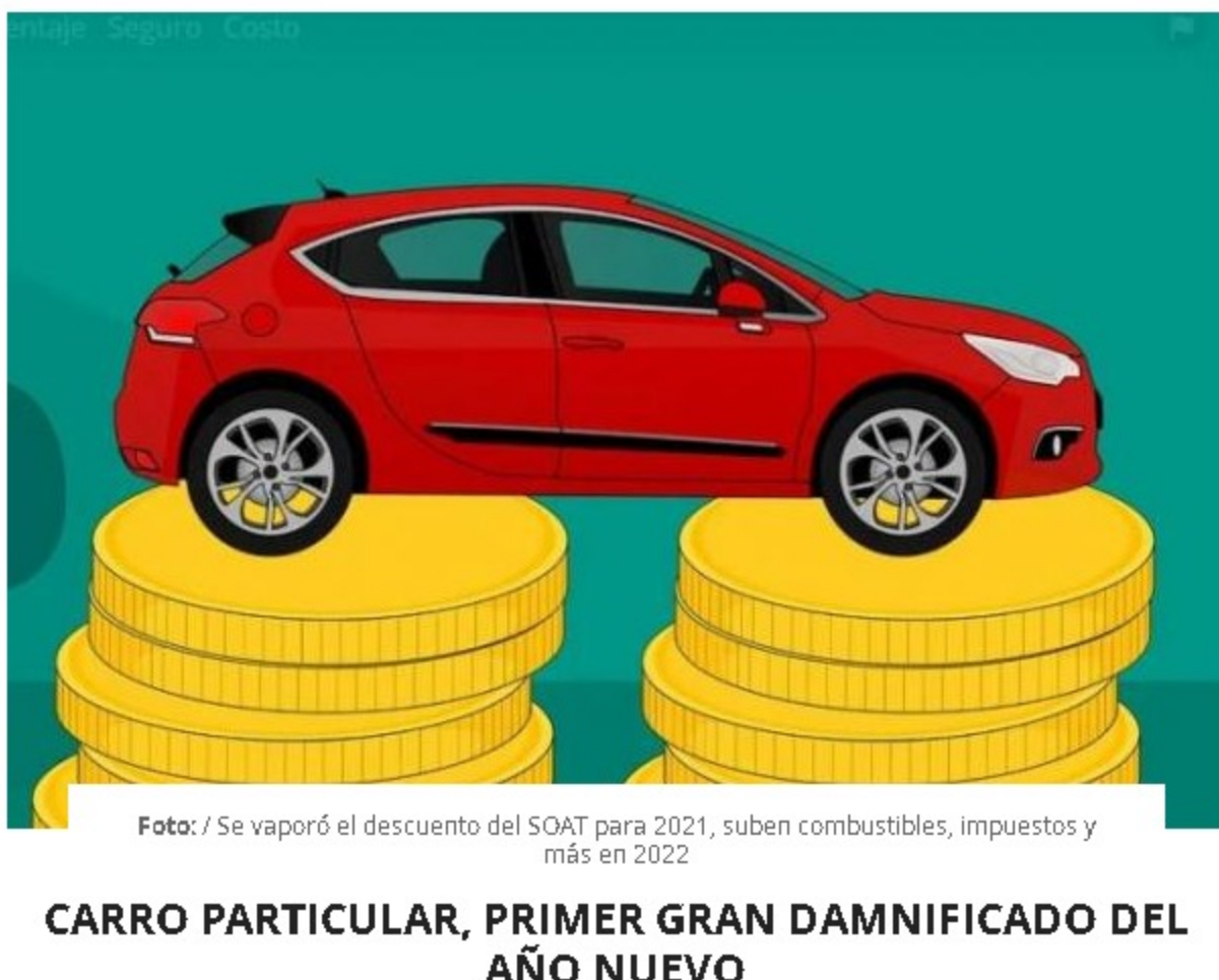
Foto: / Se vaporó el descuento del SOAT para 2021, suben combustibles, impuestos y más en 2022