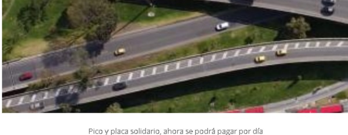
Pico y placa solidario, ahora se podrá pagar por día

Lea más sobre el Pico y placa lunes festivos a las entradas de Bogotá