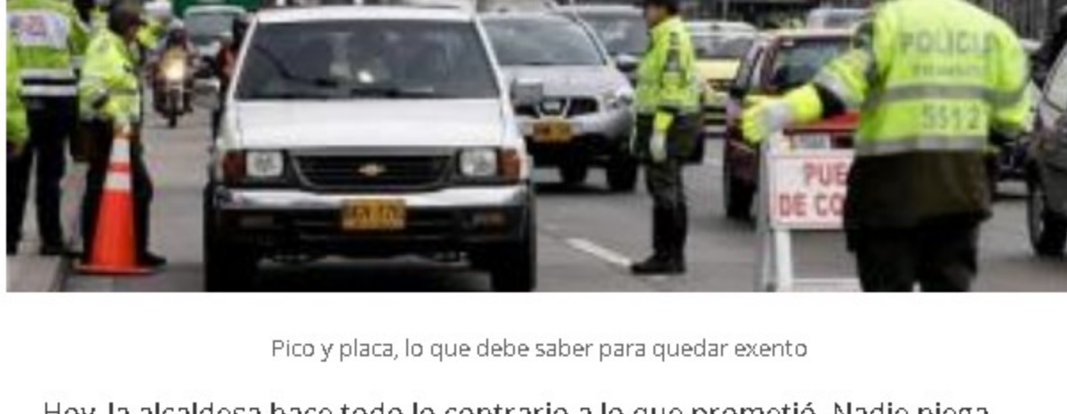
Pico y placa, lo que debe saber para quedar exento

Lea más sobre el nuevo Pico y placa extendido para Bogotá