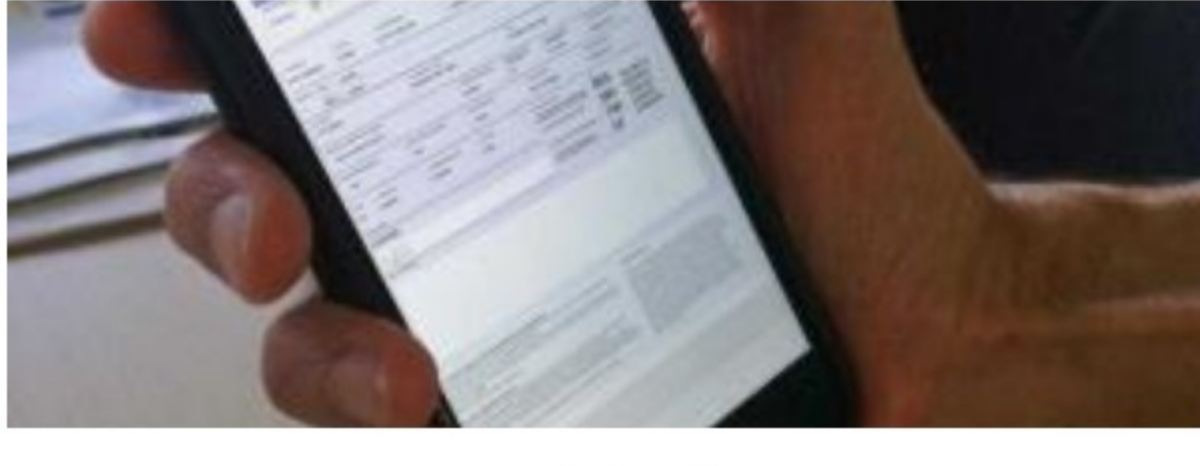
Formato electrónico del Soat

Lea más sobre el nuevo Pico y placa todo el día en Bogotá