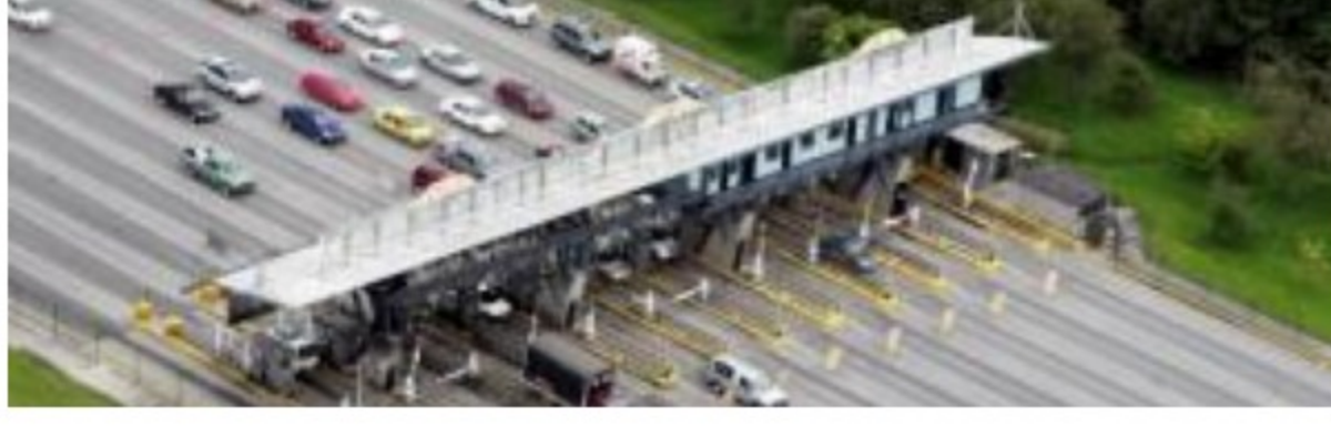
Se vienen alzas en los peajes

Porque además del aumento del precio del Seguro Obligatorio de Accidentes de Tránsito, Soat; el precio de la revisión técnico-mecánica, de los seguros todo riesgo, de los impuestos, también habrá que 'sufrir' las alzas de los peajes, de la multas, grúas y patios , de los parqueaderos, para hablar solamente de los que facturan tanto el Gobierno Nacional como las alcaldías, como la de Bogotá, que decidió ponerle precio al trancón.