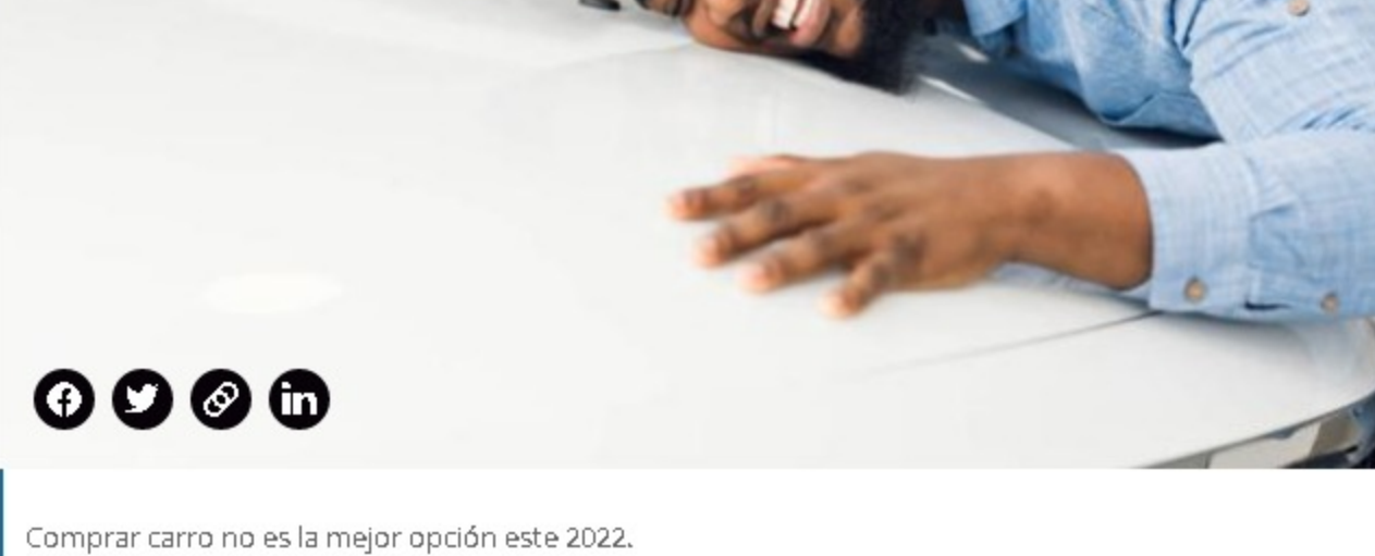
Comprar carro no es la mejor opción este 2022.

Para empezar, obligan a los dueños de carros particulares a subirse a un pésimo sistema de transporte que, además, acaba de subir el precio del pasaje. ¿Qué va a pasar con los padres de familia que llevan a sus hijos al colegio en la mañana? No hay que olvidar que muchos decidieron no volver a utilizar rutas escolares por los altos costos y la pérdida del empleo. ¿Y los que viven de su carro en pequeños negocios o emprendimientos?