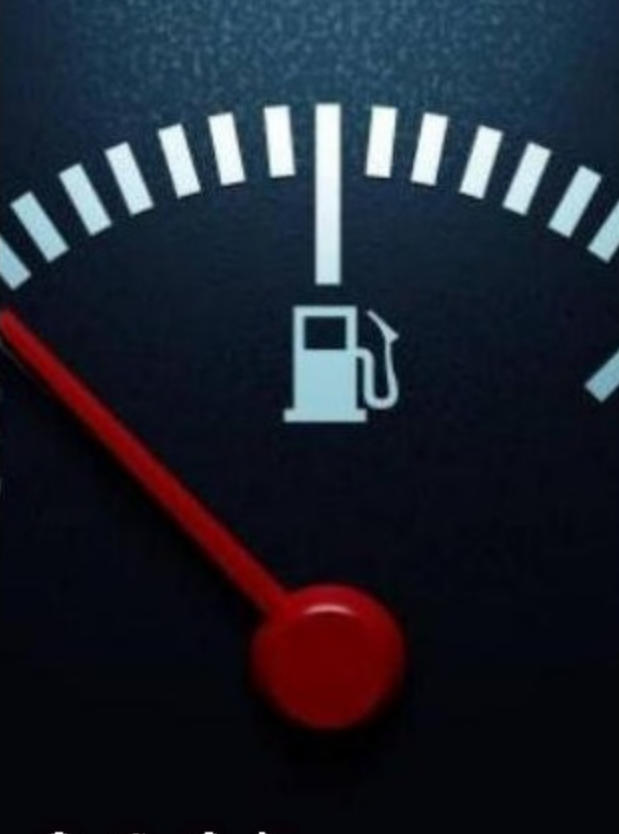
La gasolina incremento considerablemente.

Desde el 1.º de enero, el precio de la gasolina aumentó $ 176 y $ 166 el ACPM. En promedio, el galón de gasolina corriente será de $ 9.048, mientras que el precio del ACPM queda en $ 8.884.