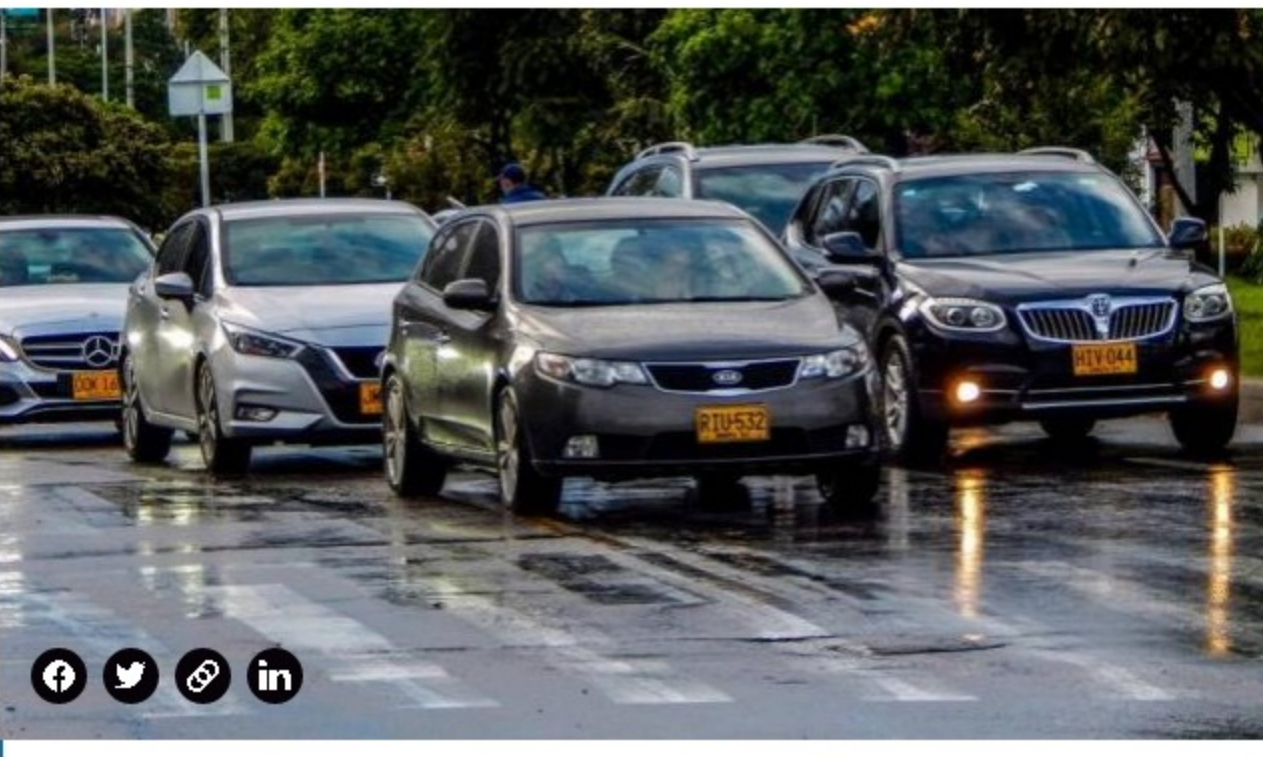
El pico y placa será durante todo el día.

Hoy, la alcaldesa hace todo lo contrario a lo que prometió. Nadie niega que la ciudad está atorada y seguirá así por mucho tiempo. El problema es que decisiones como estas afectan al ciudadano , a las familias, al comercio, quienes terminan pagando los platos rotos de la falta de visión e improvisación de las administraciones de Bogotá, las pasadas y la actual.