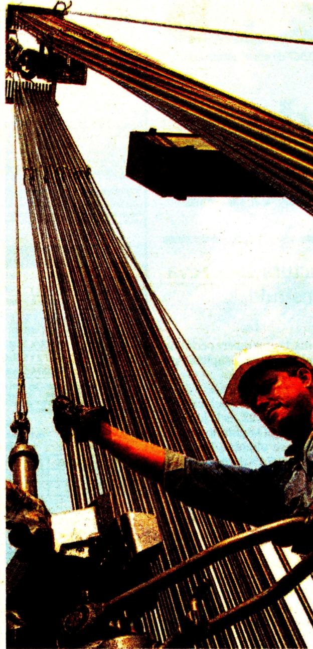
En los próximos 18 meses las petroleras de la 'segunda línea' desarrollarán los trabajos de exploración.

"Esta transacción respalda nuestra estrategia de aumentar la producción de