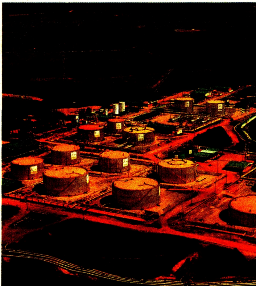
El campo Quifa (foto) hace parte del portafolio de Frontera Energy. Frontera Energy

De los 69 bloques de hidrocarburos que entregó la Nación entre 2019 y 2021 para su desarrollo, 45 quedaron en manos de 5 firmas: Frontera Energy, Parex, GeoPark, Gran Tierra Energy y Canacol. Pág. 6