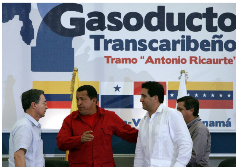
De izquierda a derecha, los presidentes Álvaro Uribe, de Colombia; Hugo Chávez, de Venezuela, y Martín Torrijos, de Panamá, durante la presentación del gasoducto Antonio Ricaurte, el 8 de julio de 2006, en Zulia, Venezuela

En ese momento se pactó que Colombia exportaría gas a Venezuela durante cuatro años, y luego compraría el gas de su vecino durante 16 años.