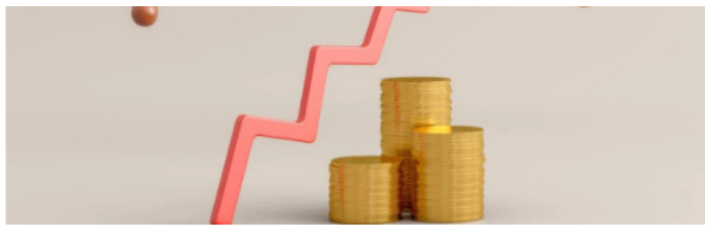
La inflación en Chile sigue obligando al Banco Central del país a subir sus tasas de interés

Dando un vistazo a las otras dos grandes referencias de la BVC, el COLSC gana a esta hora un 1,21 % hasta las 967,40 unidades, mientras que COLIR cede un 0,66 % hasta las 788,57 unidades, manteniendo de esta forma la disparidad entre estos dos. Energético y construcción son por ahora los sectores con mejor desempeño en el mercado local.