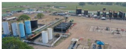
El ingreso de nuevos pozos en los departamentos del Meta, Putumayo, Casanare y Arauca, impulsaron el volumen de extracción de crudo

La Agencia Nacional de Hidrocarburos de Colombia (ANH) reportó que la producción fiscalizada de petróleo durante septiembre de este año fue de 753.584 barriles promedio por día, volumen que está 0,57% mayor a la registrada en agosto de 2022 equivalente a una variación absoluta de 4.285 barriles e indica un alza de 1,26% cuando se compara con el mismo mes del año pasado.