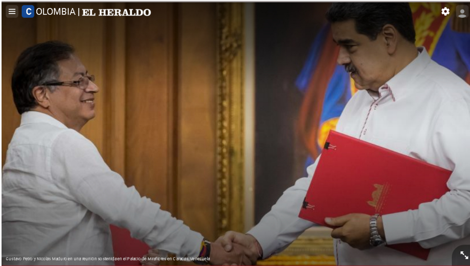
Gustavo Petro y Nicolás Maduro en una reunión sostenida en el Palacio de Miraflores en Caracas, Venezuela