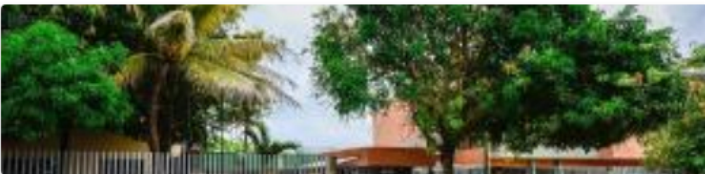
Ataque a bala deja dos personas muertas en Repelón