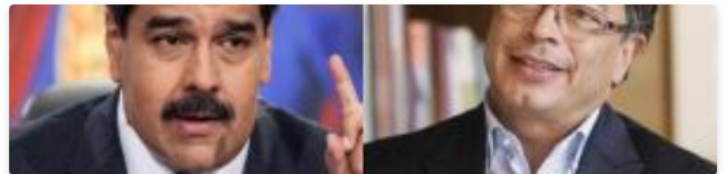
Esta sería la agenda de Gustavo Petro en Caracas durante visita a Maduro