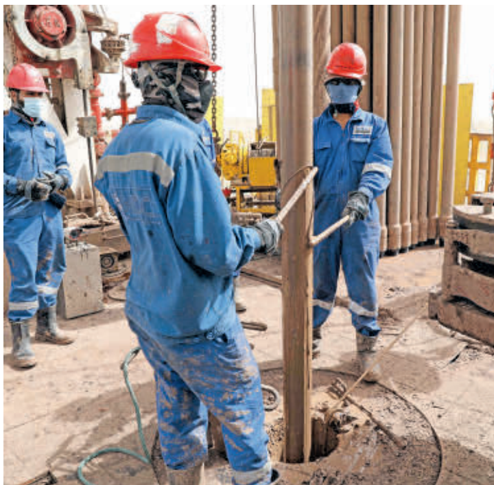
Ecopetrol Fronter, Parex y Hocol son algunas de las compañías que apelan al recobro para subir producción.