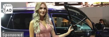
Bogotá: Los carros sin vender de 2020 casi se Promoción de Carros | Enlaces Publicitarios

Durante su visita a Cartagena, la Ministra Vélez Torres visitó el proyecto piloto de generación de hidrógeno verde que tiene Ecopetrol en la Refinería de Cartagena. En medio del recorrido la Ministra resaltó el potencial que tiene Colombia para ser uno de los principales exportadores latinoamericanos de hidrógeno verde en el mediano plazo.