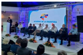
Avanza la reapertura de la frontera con Venezuela

Esta refinería, que fue inaugurada en octubre de 2015 por el presidente Juan Manuel Santos, tuvo un costo final de 8.016 millones de dólares, más del doble de los 3.777 millones de dólares presupuestados inicialmente.