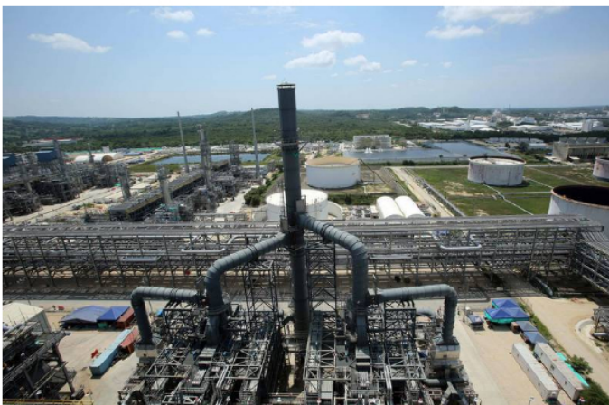
Refinería Reficar en Cartagena.

Además a estos exfuncionarios se les impuso una sanción de por vida para contratar con el Estado. La decisión fue apelada.