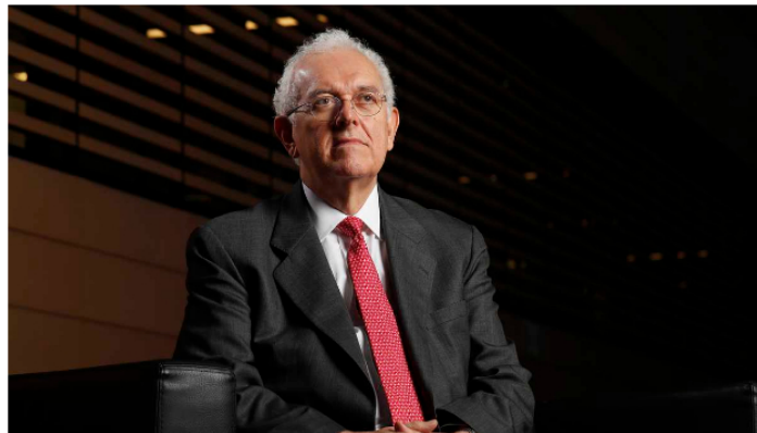
Ministro de Hacienda y Crédito Público José Antonio Ocampo. Bogotá agosto 9 del 2022.

VICKY DÁVILA: Ministro, ¿sacar adelante una reforma tributaria es un chicharrón?