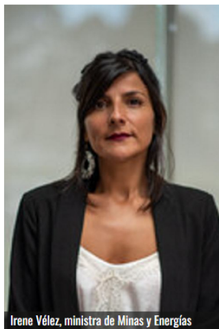
Irene Vélez, ministra de Minas y Energías

Y, con esto, es posible que se retome el debate de lo que ocurriría con el precio del bien en el país. Según Ecopetrol , el costo del gas domiciliario podría triplicarse en caso que se opte por cesar la exploración y extracción del combustible.