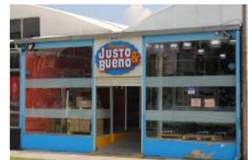
Supersociedades publicó cronograma para la entrega de los locales de Justo & Bueno