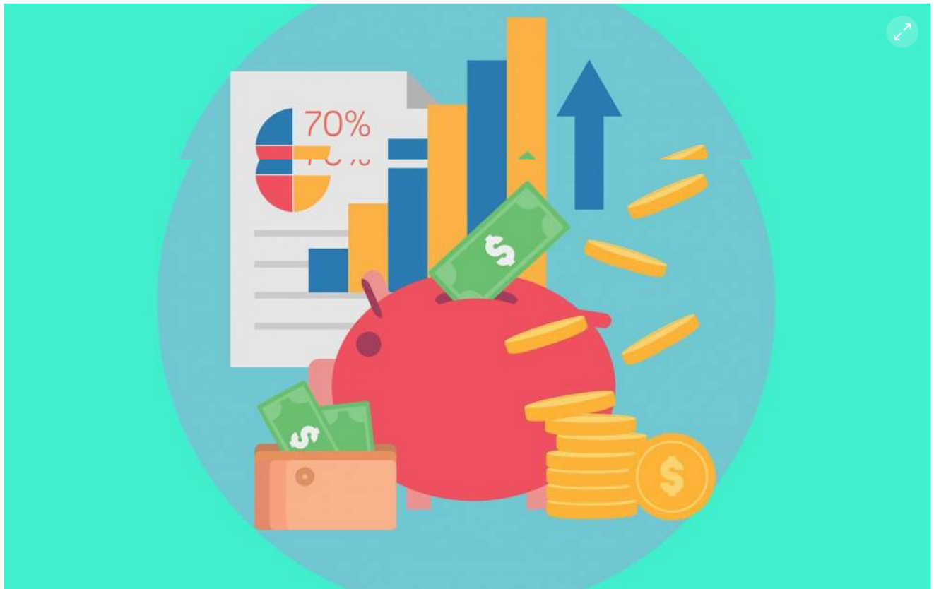
El saldo de las colocaciones de crédito en el Valle aumentó 2,8% a septiembre de 2021. Se ubicó en $46,5 billones al cierre del tercer trimestre de 2021.