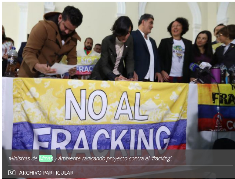
Ministras de Minas y Ambiente radicando proyecto contra el 'fracking'.

En el país, cabe recordar, hay dos proyectos pilotos de investigación: Kalé y Platero.