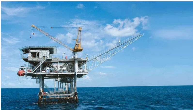
Ecopetrol descubrió gas en el Caribe colombiano.

La empresa estatal Ecopetrol anunció este miércoles que el pozo exploratorio y delimitador Gorgon-2 comprobó la presencia de gas en aguas ultra profundas en el sur del Caribe colombiano, con una columna de agua de cerca de 2.400 metros, la más grande hecha en Colombia, y una profundidad total superior a los 4.000 metros.