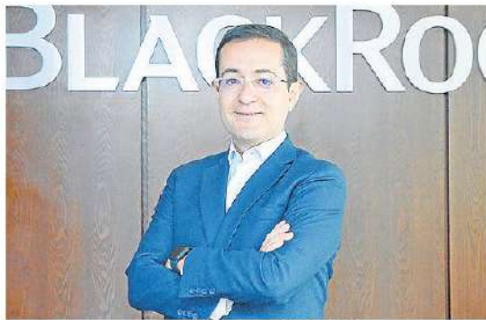
Piero Arceles / LR

En los primeros tres meses del año, el Mercado Global Colombiano (MGC) de la Bolsa de Valores de Colombia (BVC) alcanzó una negociación de $84.000 millones, lo que equivale a 63% del total negociado en 2021. Los resultados se deben a la dinámica de los ETF. En este instrumento, BlackRock ya tiene $58.000 millones en activos bajo custodia, según Diego Mora , director general de la compañía en Colombia. (C)