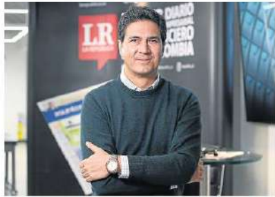
Piero Arceles / LR

Bancoldex emitirá bonos sociales a través de la Bolsa de Valores de Colombia (BVC) el próximo 11 de mayo. El monto de la oferta oscilará entre los $400.000 millones y $700.000 millones, dependiendo de la demanda de papeles que presente el público. "Desplegaremos instrumentos de financiación para que las empresas más afectadas por la crisis tengan el capital que necesitan", dijo Javier Díaz , presidente de la entidad. (C)