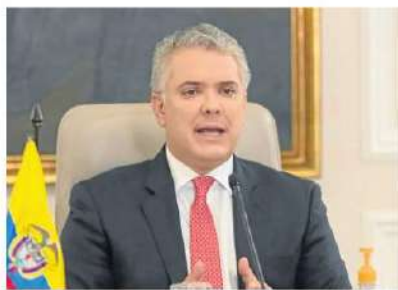
Presidencia de la República

El presidente de la República, Iván Duque , participó ayer en el Foro de Financiamiento para el Desarrollo del Consejo Económico y Social de las Naciones Unidas, ONU , en donde dijo que es importante fortalecer el apoyo a los países de la región para enfrentar momentos difíciles como la pandemia. También invitó a los inversionistas institucionales para que puedan fomentar la generación de empleo. (NGG)